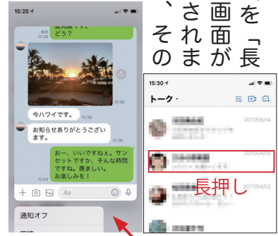
このあたりをタップで解除 画面イメージはiPhone のものです